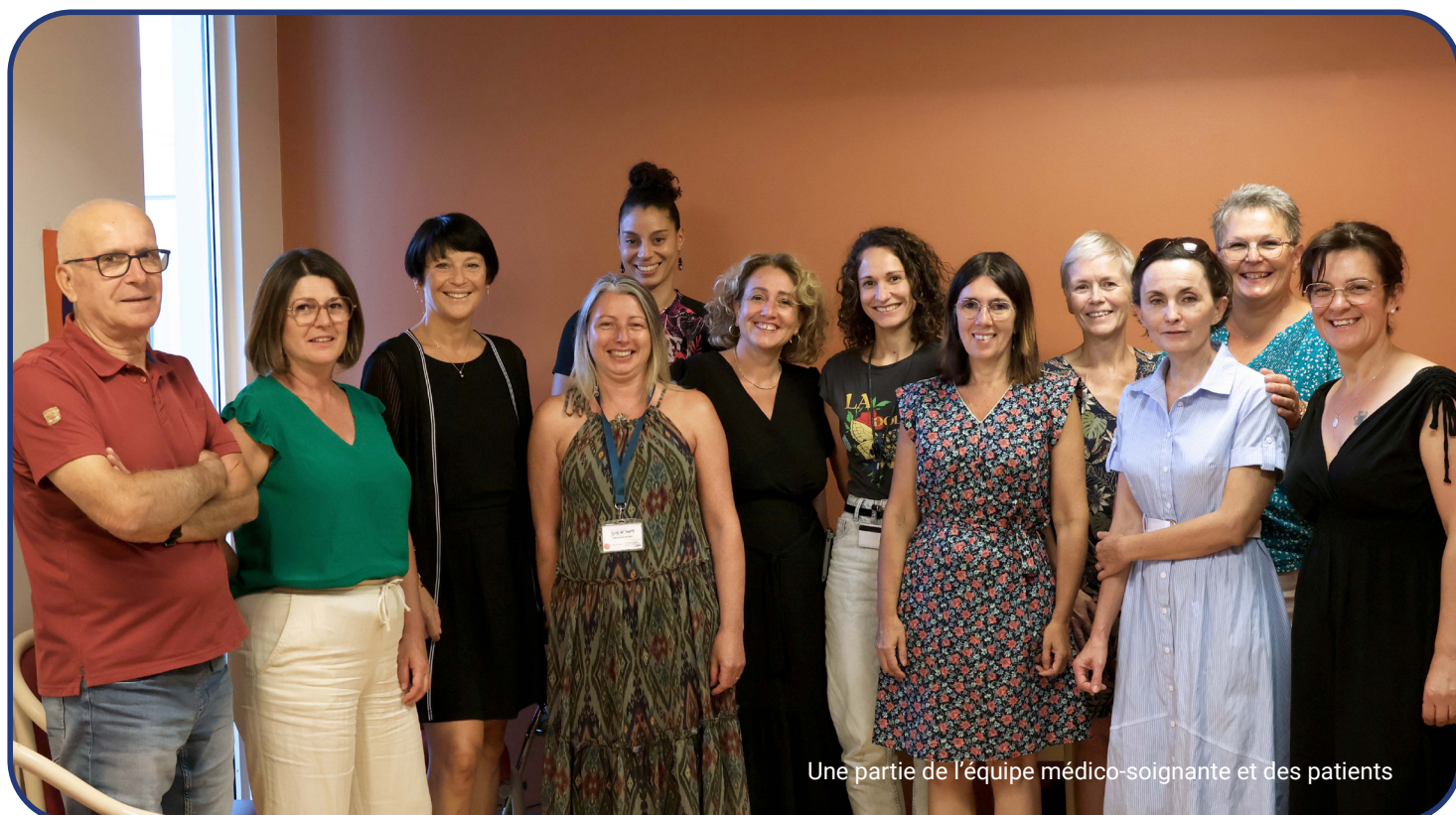
Une partie de l'équipe médico-soignante et des patients

UN ESPACE BIEN-ÊTRE EN SOINS DE SUPPORT INÉDIT EN FRANCE